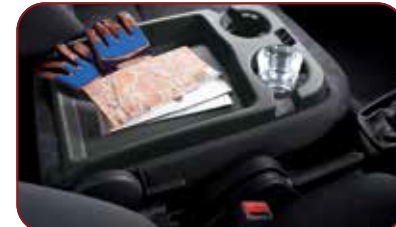
Konsol Sandaran Tangan