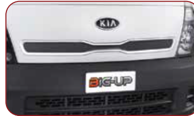
Desain Front Lid Lebih Modern