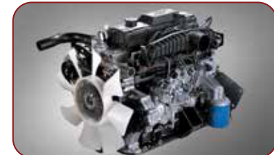
J2 Engine 2700cc