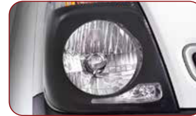
Head Lamp dengan Black Bezel