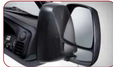
Outside Mirror Assist & Main Mirror Sighting