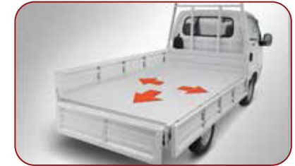
Bak dengan 3 Way Opening System